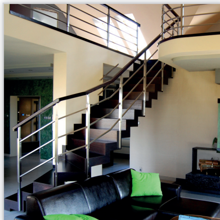
Schody Prudlik, Model: SP001. Nowoczesne schody dywanowe. Balustrada: stal nierdzewna. Drewno: venge. Projekt i wykonanie: Schody Prudlik.