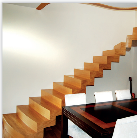
Schody Prudlik, Model: SP024. Nowoczesne schody dywanowe. Drewno: dąb naturalny. Projekt i wykonanie: Schody Prudlik.