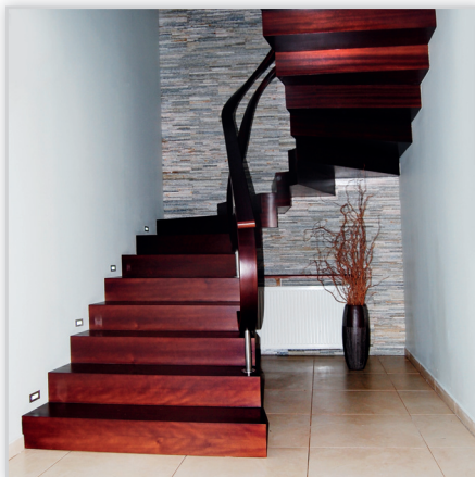
Schody Prudlik, Model: SP007. Nowoczesne schody dywanowe. Balustrada: stal szlachetna łączona z drewnem. Drewno: mahoni, sapeli. Projekt i wykonanie: Schody Prudlik.