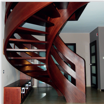
Schody Prudlik, Model: SP049. Schody ażurowe na policzkach giętych. Balustrada: wstęgowa. Drewno: mahoni, sapeli. Projekt i wykonanie: Schody Prudlik.