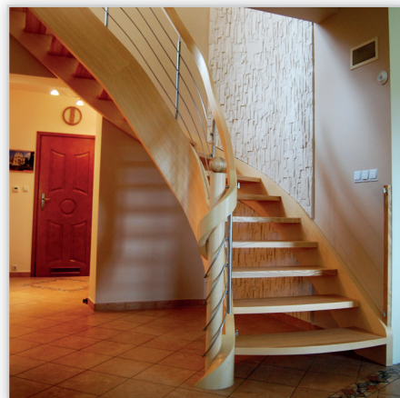
Schody Prudlik, Model: SP013. Jednozabiegowe schody ażurowe na policzkach giętych. Balustrada: stal nierdzewna i drewniany pochwyty. Drewno: jesion naturalny. Projekt i wykonanie: Schody Prudlik.