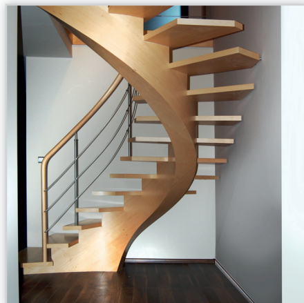
Schody Prudlik, Model: SP005. Ażurowe schody na giętej belce. Balustrada: stal nierdzewna z drewnianym pochwytem. Drewno: klon naturalny. Projekt i wykonanie: Schody Prudlik.