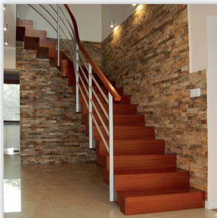
Schody Prudlik, Model: SP008. Nowoczesne schody dywanowe. Balustrada stal nierdzewna z drewnianym pochwytem. Drewno: mahoni, sapeli. Projekt i wykonanie: Schody Prudlik.